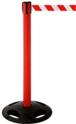
Abb. 1: GLA 25-D/13-4,0