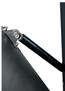
Abb.: 7707-00 Detail Gaszugfeder