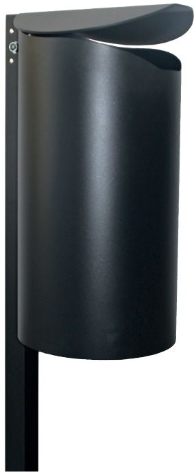
Abb.: 7707-00 in RAL 7021-Finstruktur