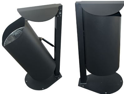
Abb.: 7707-10 geöffnet mit Bodenplatte