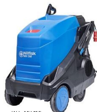
(Abb. MH 5M)

3 Jahre Gewährleistung auf Nilfisk Industripumpen