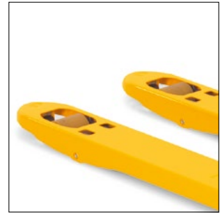
Abgerundete Gabelspitzen für leichten Einschub in die Palette