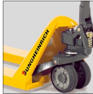
Dauerhaft geschmierte Verbindungen für einen wartungsfreien Einsatz