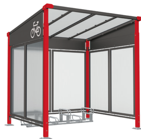
Art.-Nr. 529257 + 529252 + 529158 + 529403