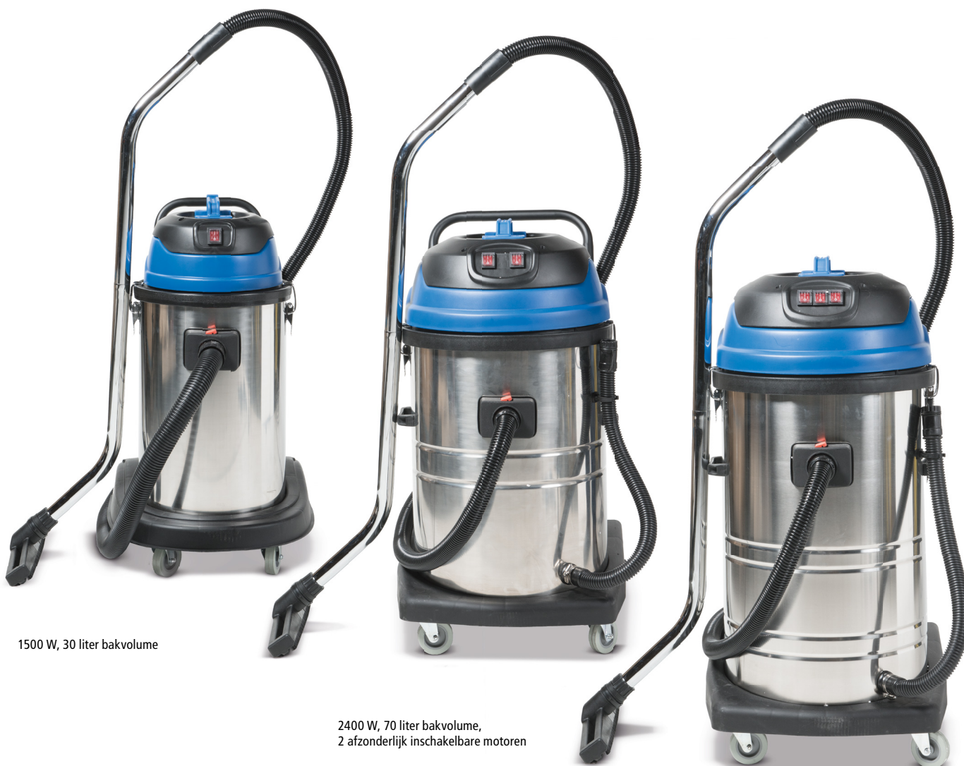
1500 W, 30 liter bakvolume